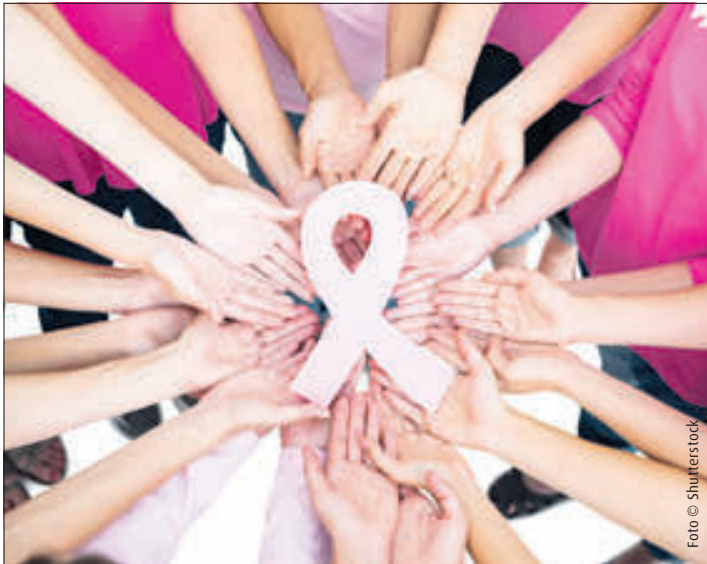
Viele Hände tragen zur Heilung bei.